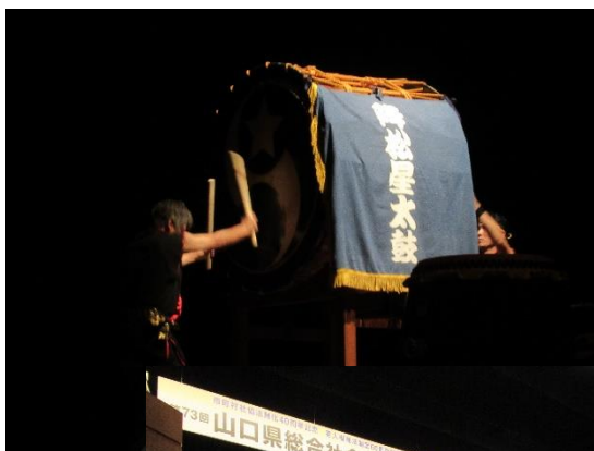
オープニングアトラクション