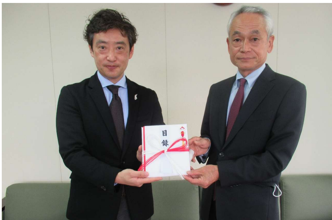
※撮影時のみマスクを外しております。

県社協ニュース“やまぐちのふくし”では、毎月1回発行し、制度や施策の動向など、随時情報提供していきます。