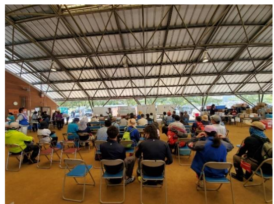
※球磨村サテライトの様子

発災から約2ヶ月近く経過した今も避難所生活を送られている方もいらっしゃり、必死に復興に向けた支援が続いています。