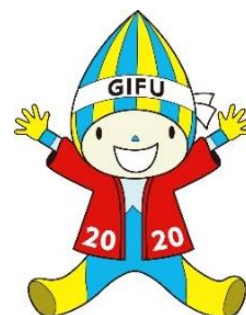
ねんりんピック岐阜2020 PRキャラクター「ミナモ」