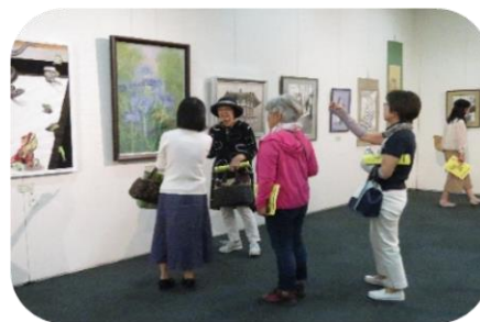
令和元年度の様子