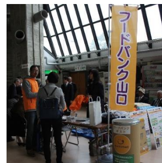
会場内の様子（フードドライブ）