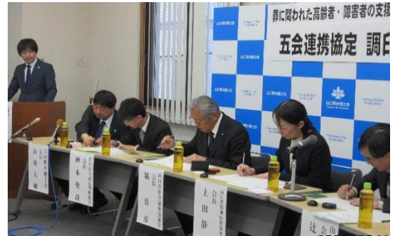
協定書に署名する各会の会長

当会は、平成30年4月1日に山口県弁護士会、山口県社会福祉士会、山口県精神保健福祉士協会との間で四会連携協定を締結し、罪に問われた高齢者・障害者（以下「対象者」）に対する刑事弁護における福祉的支援を充実させるため、研修や情報共有を通じて、連携強化に取り組んできました。