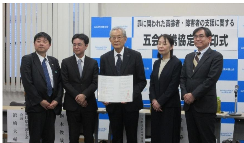
協定書を手にする県社協会長と両側に並ぶ各会の会長

※用語説明 入口支援：勾留中の方の社会復帰に向けた支援 出口支援：刑務所や少年院から出所した方の社会復帰における支援